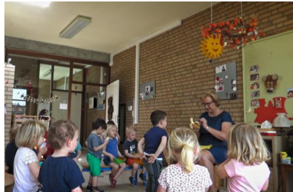
Lut in de klas